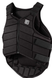
FT Turvaliivi -30% hintaan: 132,30 € !