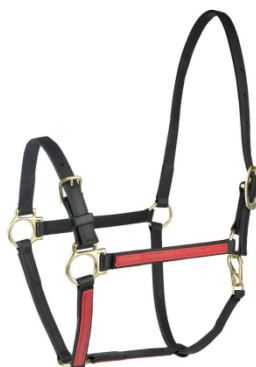
FT Beta-riimut -50% hintaan: 29,97 € !