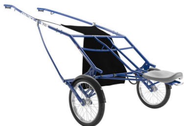
T6 - TREENIKÄRRY -20% hintaan: 1379,20 € !