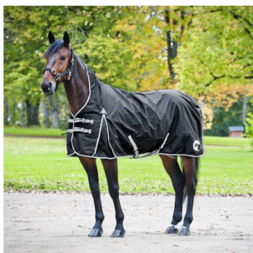
FT Sadeloimi, fleecevuorella -25% hintaan: 74,96 € !