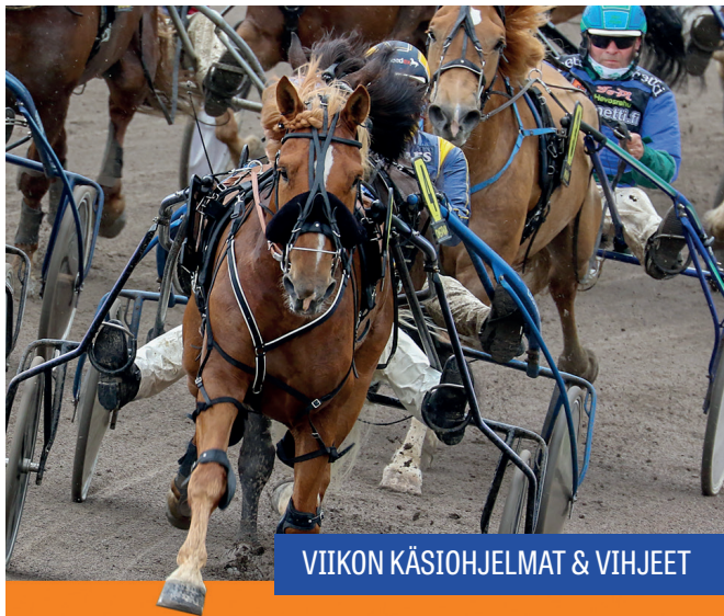
VIIKON KÄSIOHJELMAT & VIHJEET