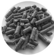
AlfaAlfa/ sinimailanen- pelletti 20 kg 10 € /säkki