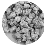
Maissipelletti 20 kg 11,50 € /säkki