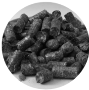
Heinäpelletti 20 kg 9 € /säkki