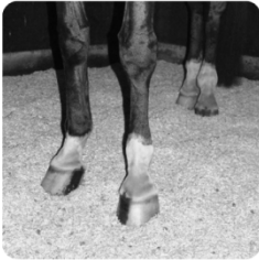
Hamppukuivike 20 kg 13,50 € /paali