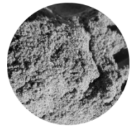
Pellavarouhe 20 kg 29 € /säkki

Tuotteita saatavana suoraan Hankasalmeilta, kulkeutuvat myös mm. Killerin & Kuopion raveihin. Kysy lisää & tilaukset: Janne Jääskeläinen / 040 728 6340 & Tanja Markkanen / 044 563 0760