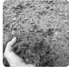
Kuiviketurve 30 kg 11,50 € / paali