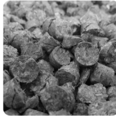
Olkipelletti 15 kg 5 € /säkki